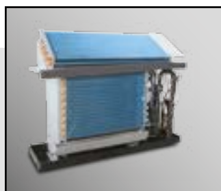
Специальное покрытие теплообменника Blue Fin полностью защищает от коррозии