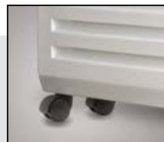
Мобильные шасси для напольной установки и транспортировки в комплекте