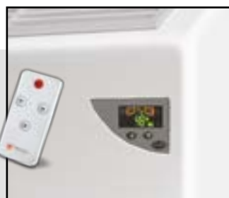
Удобное управление на корпусе и пульт ДУ