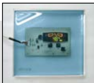
Влагостойкий контроллер со встроенным гигростатом